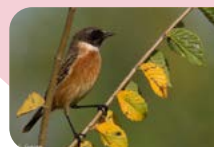
Tarier pâtre

Cette étude très utile, permettra à l'association de pêche d'adapter son entretien des étangs et de préserver la richesse de cette biodiversité.