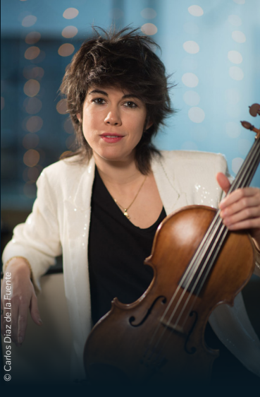
© Carlos Diaz de la Fuente