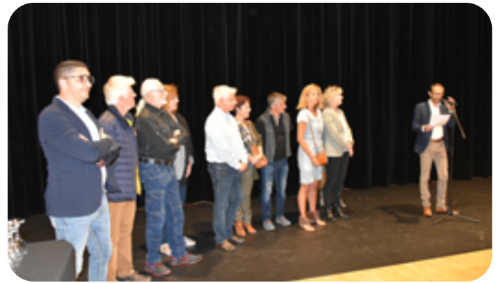
▲ C'est avec joie que le Maire, Christophe Revil, et les élus ont accueilli les nouveaux Claixois

Le 7 octobre dernier, la traditionnelle soirée d'accueil des nouveaux habitants était organisée au Déclic. En plein cœur de ce lieu emblématique de la culture claixoise, le Maire Christophe Revil, a tenu à accueillir en toute simplicité la trentaine de familles claixoises qui avait répondu favorablement à son invitation.