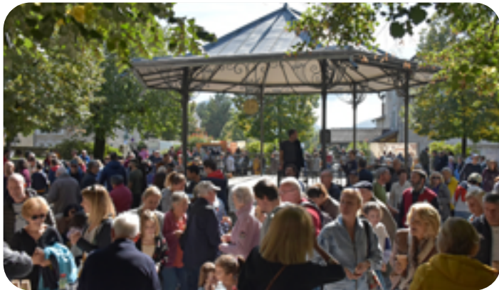
▲ Les Claixois étaient nombreux au rendez-vous !

Dimanche 2 octobre dernier, les habitants de la commune étaient invités à la traditionnelle Aubade aux Claixois, au pied du célèbre kiosque à musique.