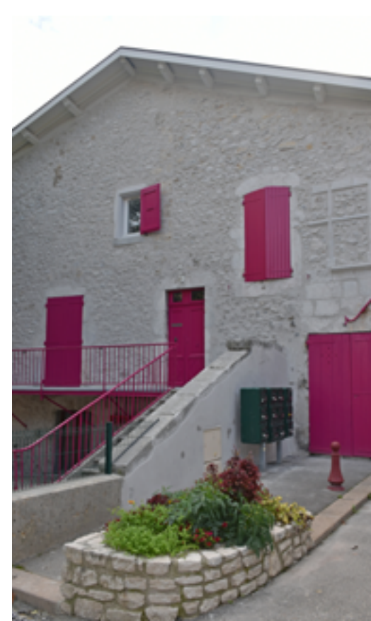
L'ancienne cure rénovée avec ses 3 appartements en plein cœur du Bourg ▶

UTPT, dans la continuité de sa démarche sociale, fait bénéficier à ses locataires d'une gestion locative de proximité, tout au long de l'occupation du logement. La qualité environnementale des logements n'est pas en reste puisque tous bénéficient d'une rénovation haute performance énergétique (DPE étiquette B). Plus d'information sur le site www.untoitpourtous.org