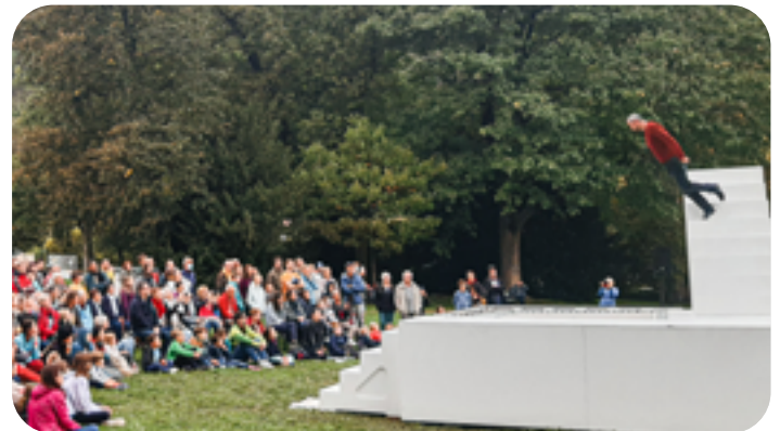
▲ Le spectacle Opening : un moment suspendu, offert au public.