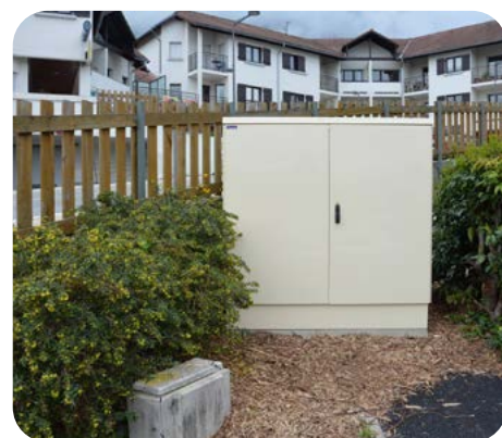
▲ Exemple d'une "armoire fibre" à Claix, point de mutualisation entre la fibre optique acheminée par les opérateurs commerciaux et le raccordement vers les abonnés.

Pour agir auprès des propriétaires ayant refusé une implantation de poteaux, et pour bien leur expliquer les conséquences d'un refus, plus d'une trentaine de courriers leur ont été adressés personnellement par le Maire ces derniers mois.