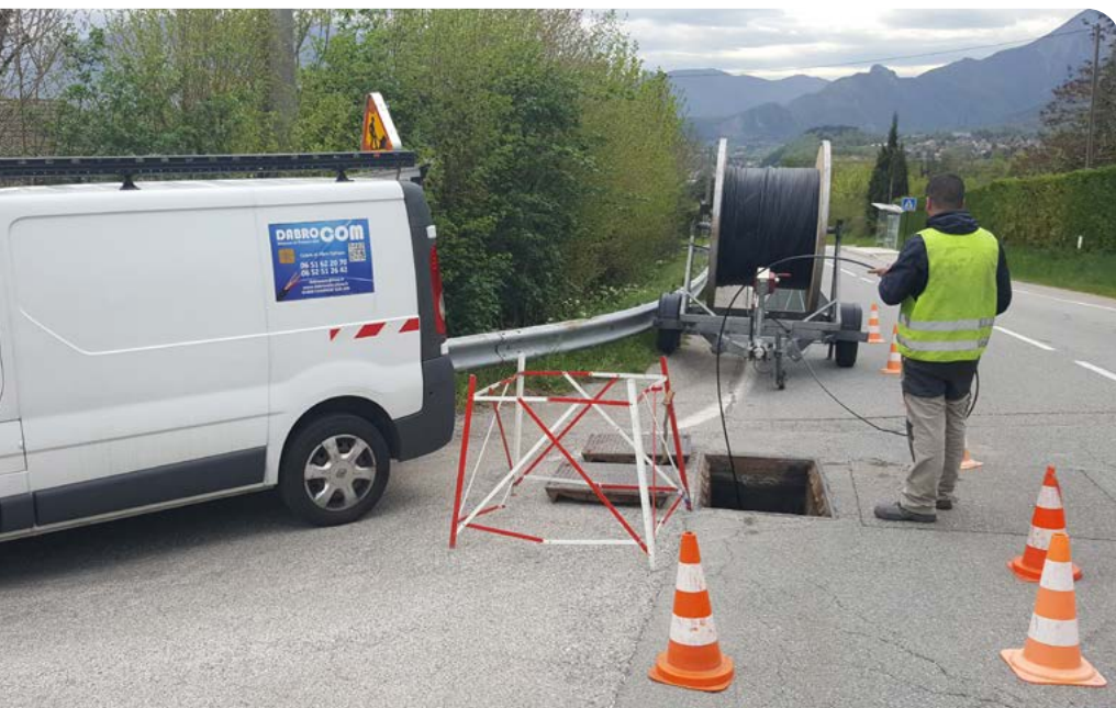
◀ Déploiement de la fibre : Opérateur faisant passer les câbles par les infrastructures souterraines existantes.

Enfin, la commune intervient en appui pour étudier les possibilités réglementaires permettant l'implantation des poteaux.