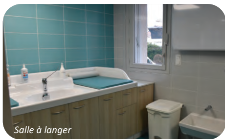
Salle à langer

Nouveaux locaux de la halte garderie Petit Prince