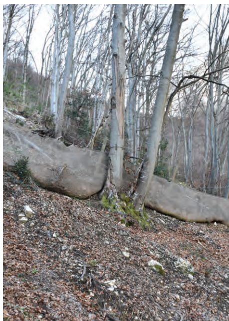
Filet de sécurité, route du Peuil

www.metrovelo.fr/585-le-marquage-bi-cycode.htm