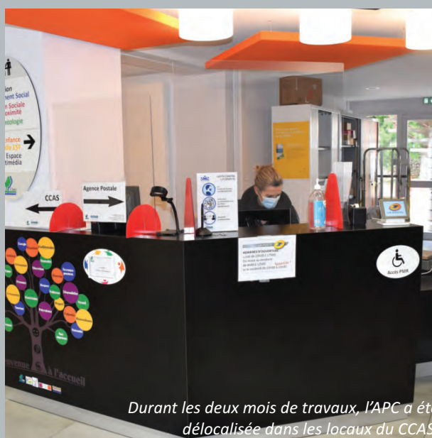
Durant les deux mois de travaux, l'APC a été délocalisée dans les locaux du CCAS.

Le parti pris en 2017 de maintenir un service postal sur la commune a payé. 4 ans plus tard, 60 usagers en moyenne fréquentent chaque jour l'APC. Si au départ il s'agissait d'une expérimentation celle-ci s'est avérée concluante. Néanmoins, l'Agence Postale Communale trouvait place dans un espace partagé avec l'entrée de l'Hôtel de Ville. Cette promiscuité n'optimisait pas totalement le service. La crise sanitaire obligeant de surcroît à séparer les accès et de facto à proposer un service en extérieur, l'équipe municipale a dès lors envisagé très rapidement de réaménager l'endroit.