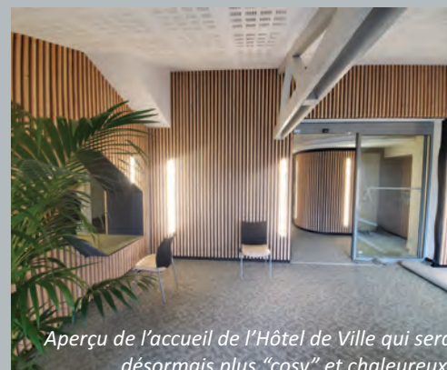
Aperçu de l'accueil de l'Hôtel de Ville qui sera désormais plus «cosy» et chaleureux.