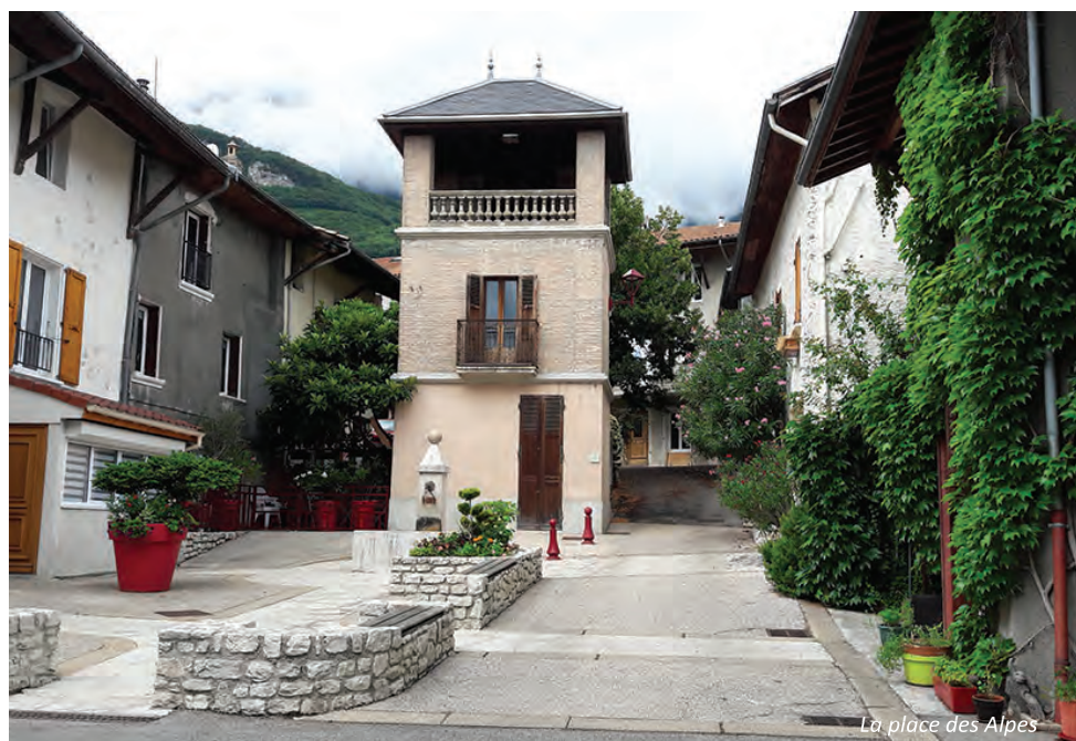
La place des Alpes