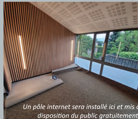
Un pôle internet sera installé ici et mis à disposition du public gratuitement.

Le réaménagement de l'Agence Postale Communale s'inscrit dans le projet global de redynamisation du bourg de Claix « Cœurs de Ville Cœurs de Métropole ». Celui-ci a notamment vocation à maintenir des services publics attractifs. Médiathèque, CCAS, APC, Hôtel de Ville, le Multi-Accueil Cœur Village, tous ces équipements publics implantés au cœur de la commune sont de véritables locomotives pour faire vivre le centre.