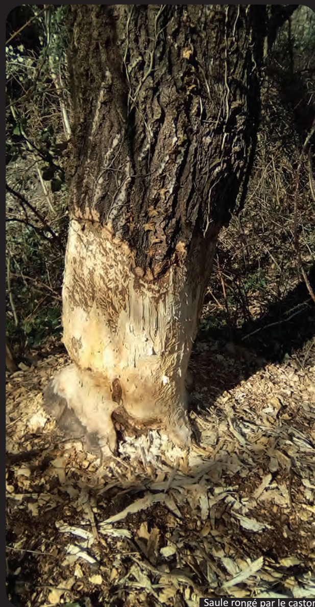
Saulle rongé par le castor