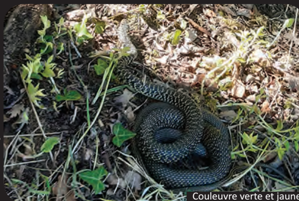
Couleuvre verte et jaune