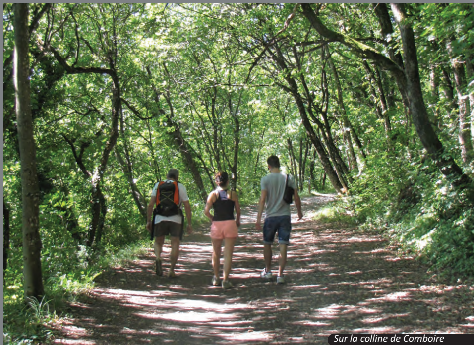
Sur la colline de Comboire