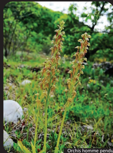
Orchis homme pendu