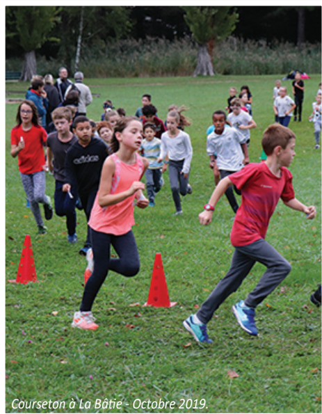
Courseton à La Bâtié - Octobre 2019.