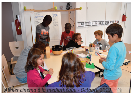
Atelier cinéma à la médiathèque - Octobre 2019

L'objectif : Sensibiliser les élèves à l'environnement et valoriser le patrimoine des écoles et du territoire (partenariat EREA et Apiculteur Clairois).