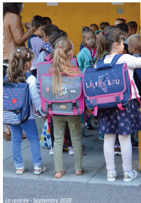
La rentrée - Septembre 2020

Pour des raisons de sécurité, les parents doivent accompagner leur(s) enfant(s) jusque dans les locaux d'accueil prévus à cet effet.