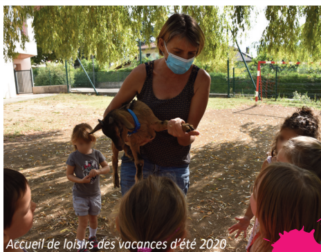
Accueil de loisirs des vacances d'été 2020