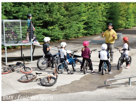
BMX - École des sports

Les enfants inscrits à l'École des Sports du mardi soir pourront utiliser le transport scolaire "Arrêt La Bâtie" dans la limite des places disponibles.