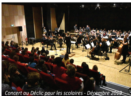
Concert au Déclat pour les scolaires - Décembre 2019