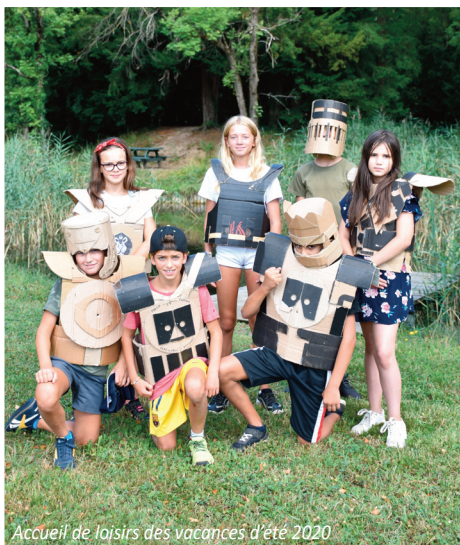
Accueil de loisirs des vacances d'été 2020

Vous y trouverez également les menus des repas.