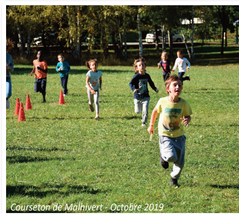
Course-ton de Malhivert - Octobre 2019

Si les parents ne se présentent pas, l'enfant sera gardé par la commune et les parents recevront un courrier recommandé de recadrage. En cas de récurrence, la commune fera appel à la Gendarmerie pour récupérer l'enfant.