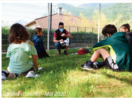
Jardins scolaires - Mai 2020