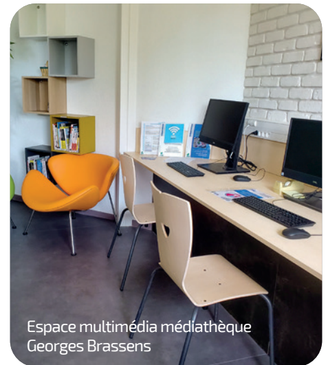
Espace multimédia médiathèque Georges Brassens