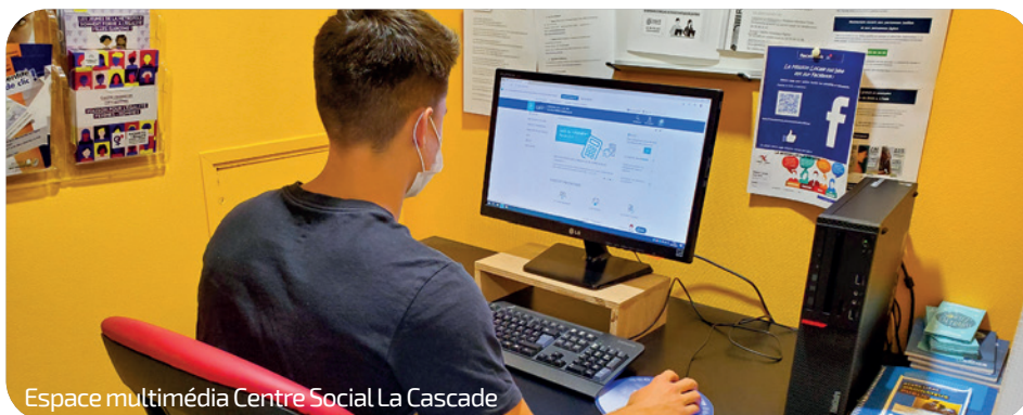
Espace multimédia Centre Social La Cascade