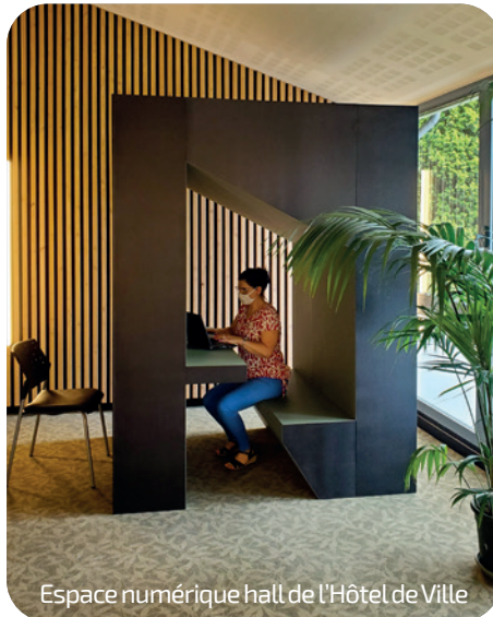
Espace numérique hall de l'Hôtel de Ville

Ici, grâce à des codes de connexion que vous aurez préalablement récupérés à l'accueil, vous pouvez surfer sur le net. Mais pour cela, vous devez être équipé d'un ordinateur, d'une tablette ou encore d'un smartphone. Toutefois, à l'extérieur de la box, un ordinateur est disponible afin de se connecter pour les démarches communales et métropolitaines (un accès plus large sera bientôt autorisé).